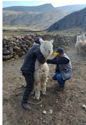
Foto: recojo de muestras de fibra de alpaca granja comunal Calcauso 25/08/2019.