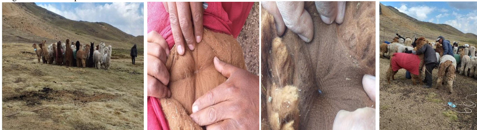
Foto: recojo de muestras de fibra de alpaca granja comunal Silco 28/08/2019.

Lugar : corra corral, tintaya Comunidad : comunidad campesina Silco Distrito : Juan Espinoza Medrano Provincia : Antabamba Región : Apurímac.