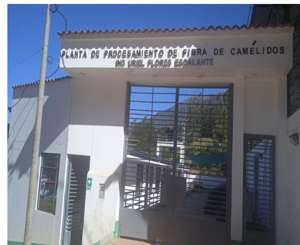
Foto: planta de procesamiento de fibra de camélidos sudamericanos DRA Apurímac 2023.