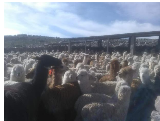
Foto: recojo de muestras de fibra de alpaca granja comunal Vito 30/08/2019.