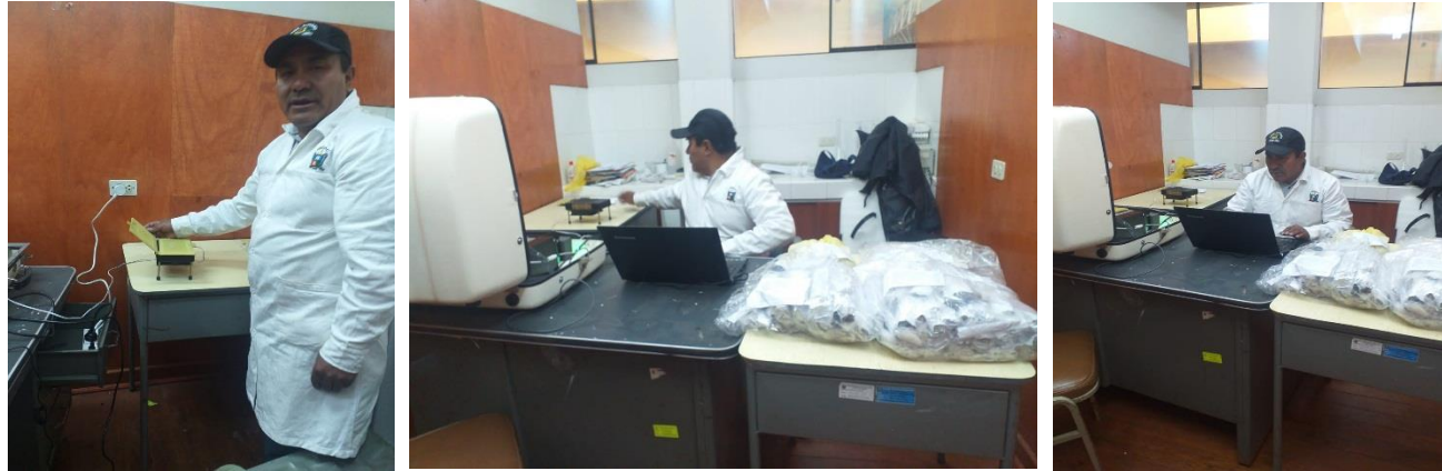
Fotos: Procedimiento de análisis de fibra con el equipo OFDA 2000. Laboratorio “UNDAC”

Análisis de diámetro de Fibra en laboratorio UNIVERSIDAD NACIONAL DANIEL ALCIDES CARRION-PASCO.