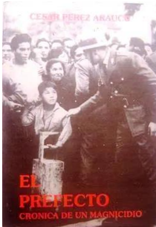
Novela El prefecto, primera edición de 1994